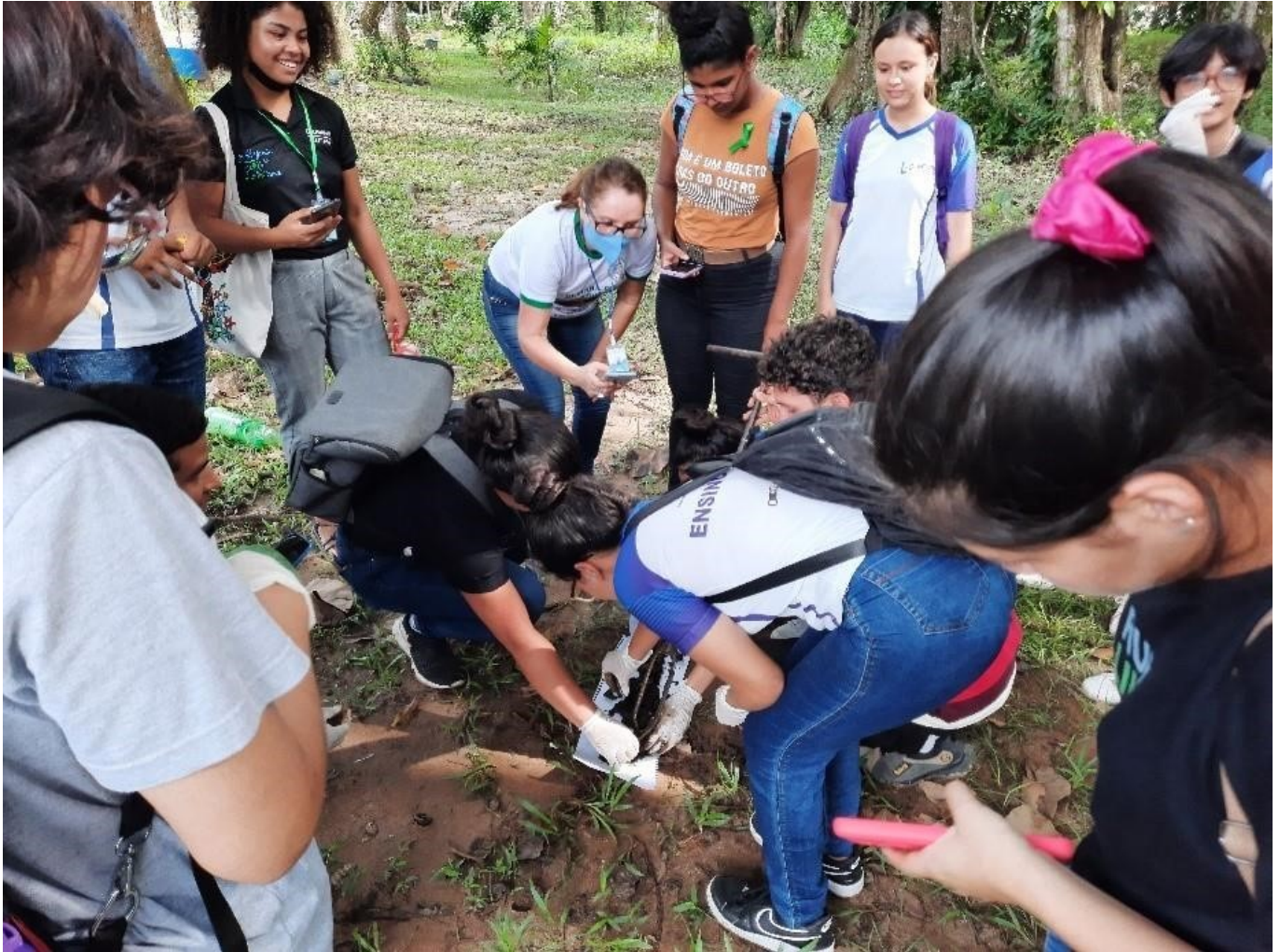
Alunos do 2º ano do ensino técnico em meio ambiente realizando a coleta de solo.