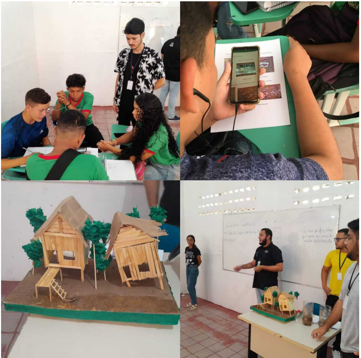
Registros da regência dos residentes na escola Monsenhor Azevedo